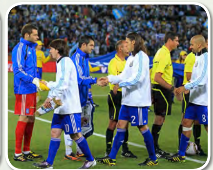
Die Profis machen es vor: Das Abklatschen ist Zeichen der respektvollen Begegnung